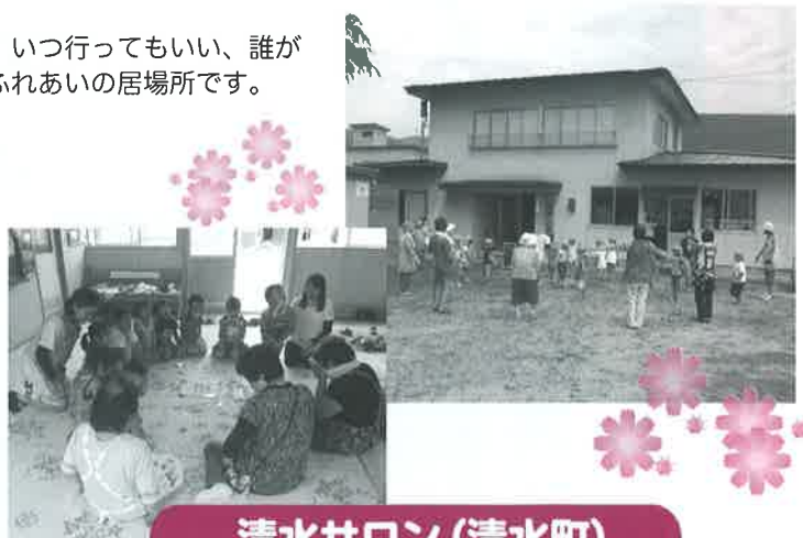
清水サロン(清水町)

旧瀬見小学校で行われているサロンでは体育館のステージを活用し、最上町観光ボランティアガイド協議会による演劇を鑑賞しました。