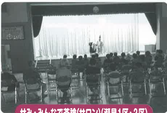
せみ・みんなで茶論(サロン)(瀬見1区・2区)

地域の「仲間づくり」「出会い」がある居場所です。いつ行ってもいい、誰が行ってもいい、そこで何をしていてもいい、自由なふれあいの居場所です。