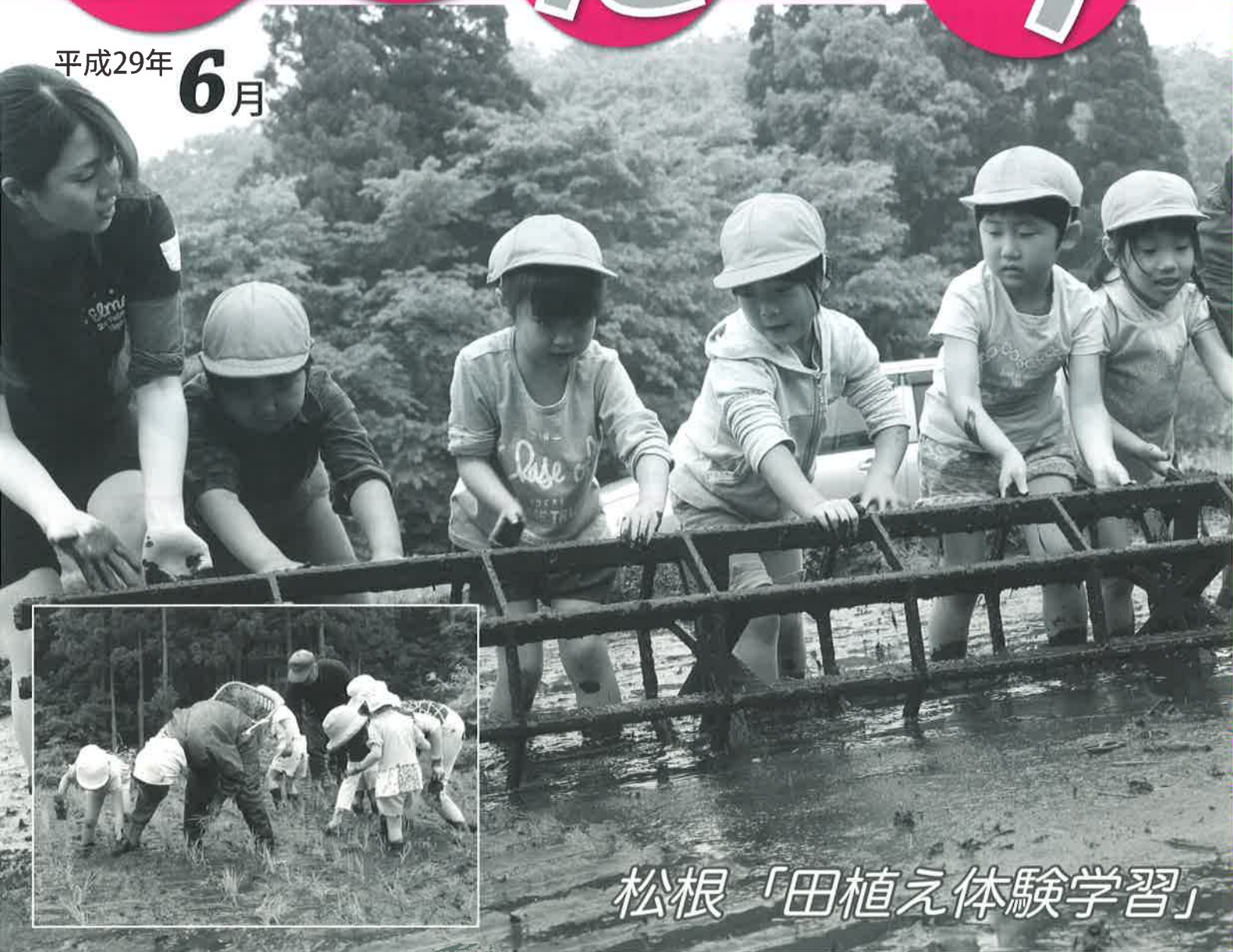
松根「田植え体験学習」