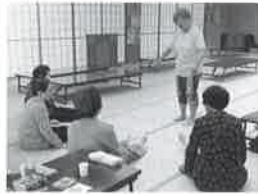
体力づくりDEぽかぽかサロ