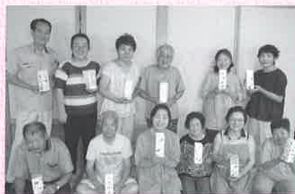
向町8区ふれあいお茶会 ～牛乳パックで灯籠作り～