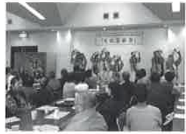
最上広域身体障害者福祉協会文化芸術祭