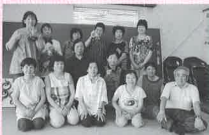
下小路いきいきサロン ～笹巻き作り～