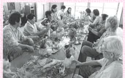
志茂ふれあいサロン ～フラワーアレンジメント～