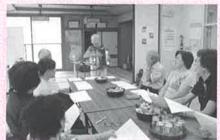
ささもりサロン会 ～アコーディオン演奏で思い出の歌～

現在、51集落で63名の健康福祉推進員の方々を中心に、参加者の皆さんと共に明るく楽しくサロン活動を盛り上げています!! どの公民館でも、皆さんの笑い声とともに明るい笑顔でいっぱいです!