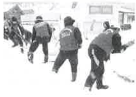
最上校除雪ボランティア