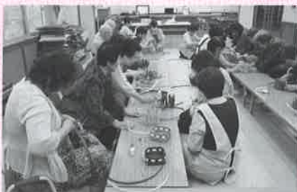
せみ・みんなで茶論(サロン) ～クラフトテープで小物作り～

現在、51集落で63名の健康福祉推進員の方々を中心に、参加者の皆さんと共に明るく楽しくサロン活動を盛り上げています!! どの公民館でも、皆さんの笑い声とともに明るい笑顔でいっぱいです!