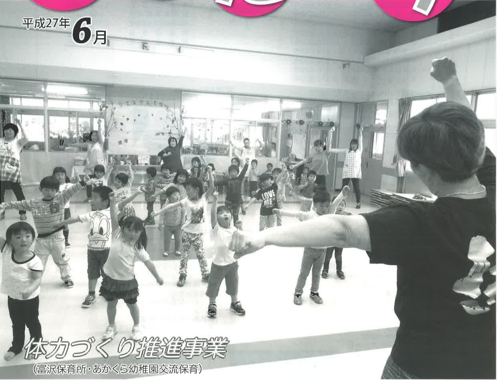
体力づくり推進事業 (富沢保育所・あかくら幼稚園交流保育)