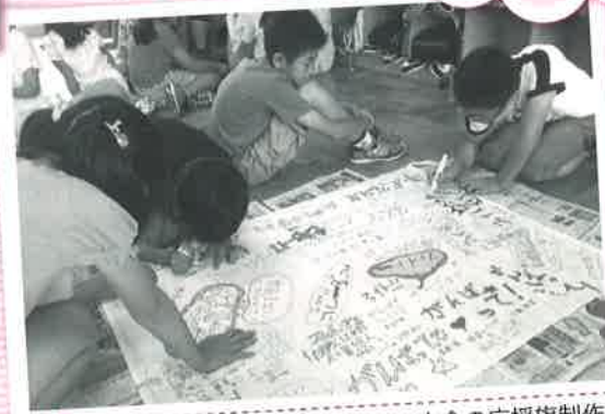
シルバー体育レクリエーション大会の応援旗制作