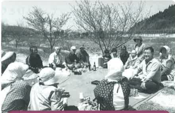
明神さずな・なごみサロン