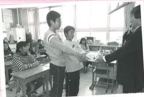
収集ボランティアで赤十字社に贈呈