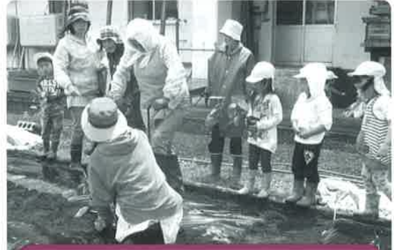
しみずサロン(清水町)

大堀保育所の園児と花植え・ふれあい交流を行い、声をかけあいながら楽しく活動しました。(5月21日)