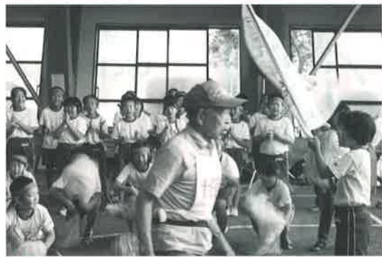
多世代交流コーディネート

大堀保育所の園児と花植え・ふれあい交流を行い、声をかけあいながら楽しく活動しました。(5月21日)