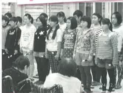
施設訪問コーディネート