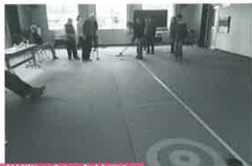
白川端いきいきサロン