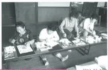
前森3区はいからサロン