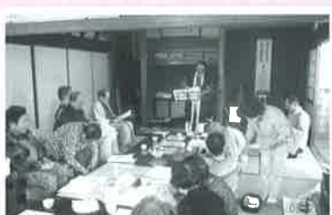
向町4区いきいきサロン