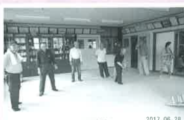
立小路ふれあいサロン