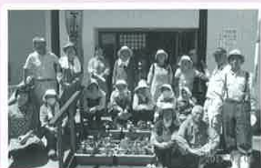
下小路いきいきサロン