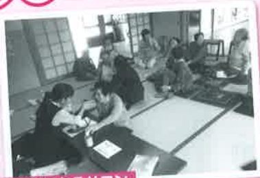
上鶴杉ほたるサロン