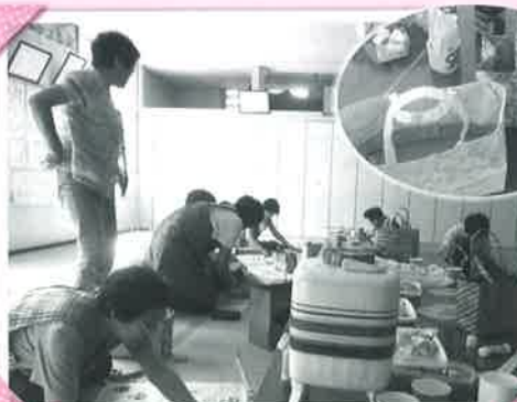
東法田サロン (新聞でマイバック製作)