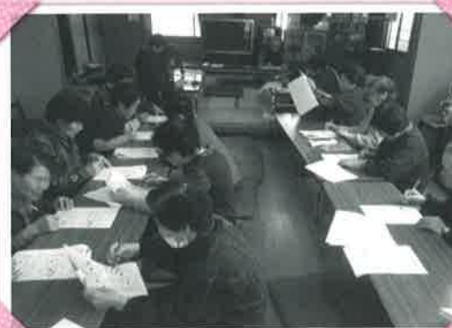
上満沢ふれあいサロン (まちがい探し)