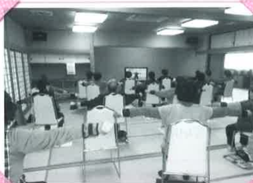
赤倉うきうきサロン (いきいき100歳体操)